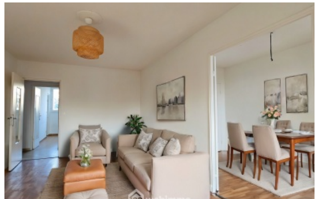
elle non contractuelle proposée par iACrea