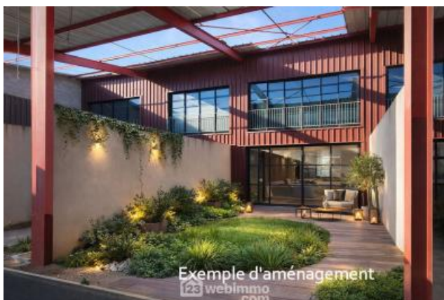
Exemple d'aménagement 123 webimmo.com